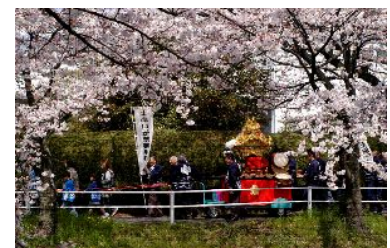
上 五条川コースをハイキング 左 竹の子狩り